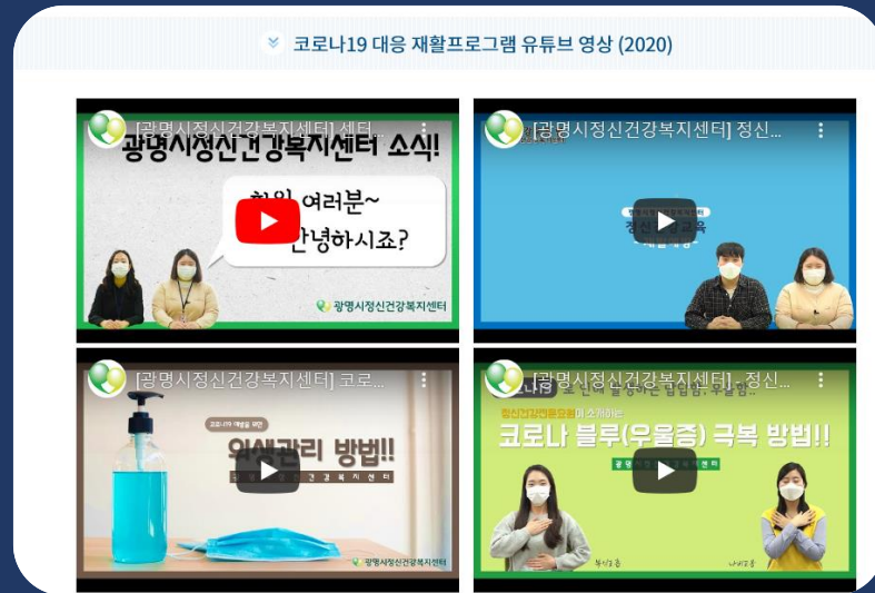
광명시정신건강복지센터 '코로나19 대응 재활프로그램' 유튜브 영상

현재 시군 정신건강복지(자살예방)센터에서는 전화상담을 늘리고 문자, 온라인 상담 등을 확대해 나가며 언택트(Untact) 시대의 대안을 찾고자 고심하고 있음.