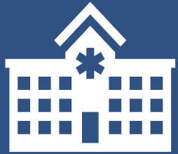
코로나19 정신응급 선별진료소